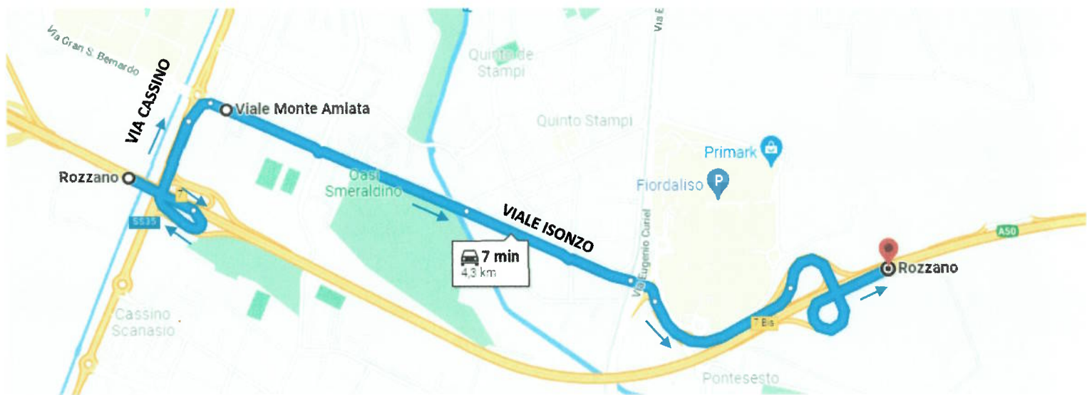
PERCORSO ALTERNATIVO PER CHIUSURA DI CARREGGIATA SUD DELLA TANGENZIALE OVEST TRA GLI SVINCOLI DI SS35 PAVIA/MI - TICINESE E ROZZANO/QUINTO DE' STAMPI